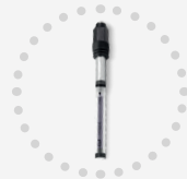
Sonde CLF Mesure du chlore libre #HOMECLF

Grâce à une connectique unique pour une évolution technique dans le temps.