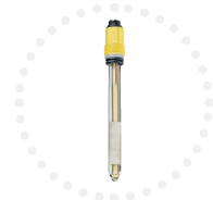
Sonde Redox Mesure en mV #NETRX