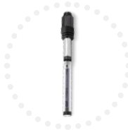
Sonde CLF Mesure du chlore libre #NETCLF

Grâce à une connectique unique pour une évolution technique dans le temps.