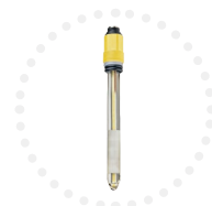
Sonde Redox Mesure en mV #ULTIMARX