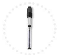
Sonde CLF Mesure du chlore libre #ULTIMACLF

Grâce à une connectique unique pour une évolution technique dans le temps.